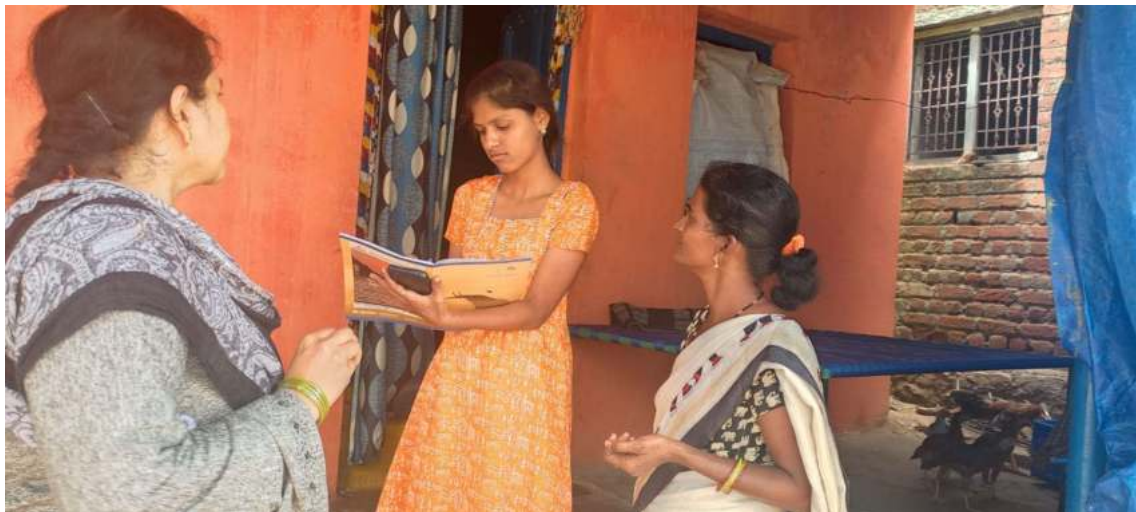
Collecting the relevant data from the students as a part of admission drive