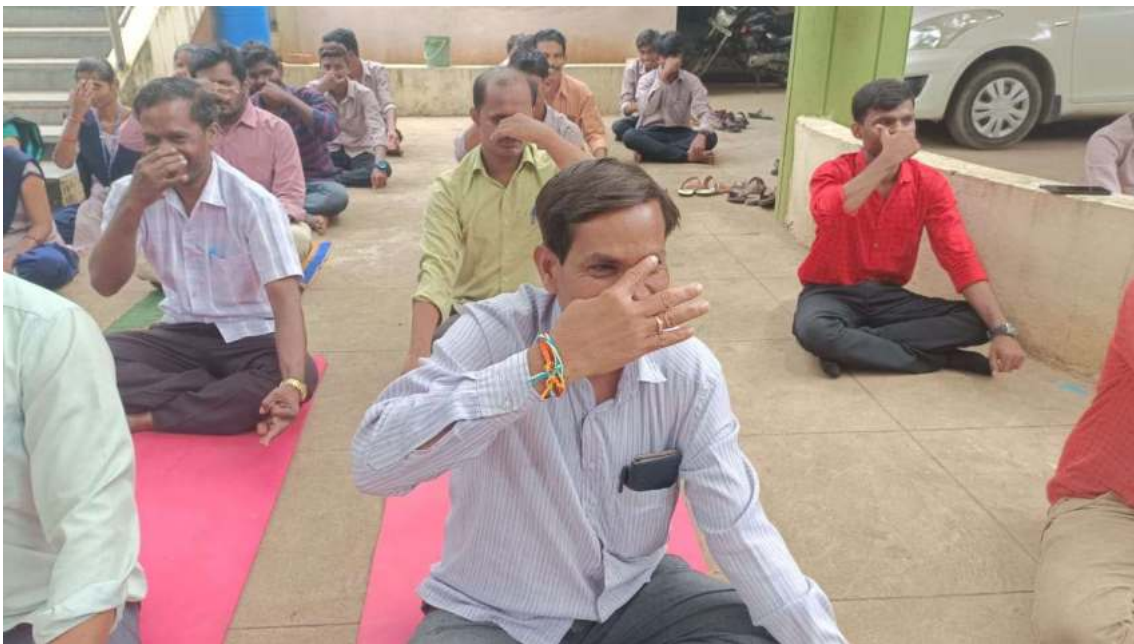
Faculty members and students in Yogic trans