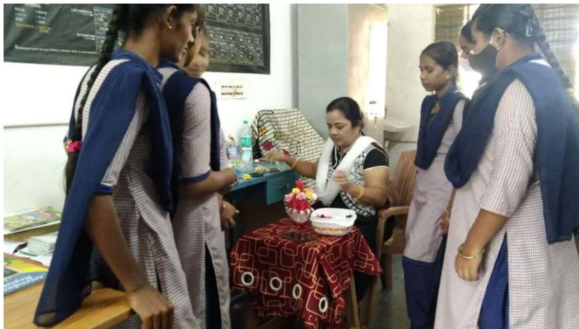
Faculty member training the students in paper art making