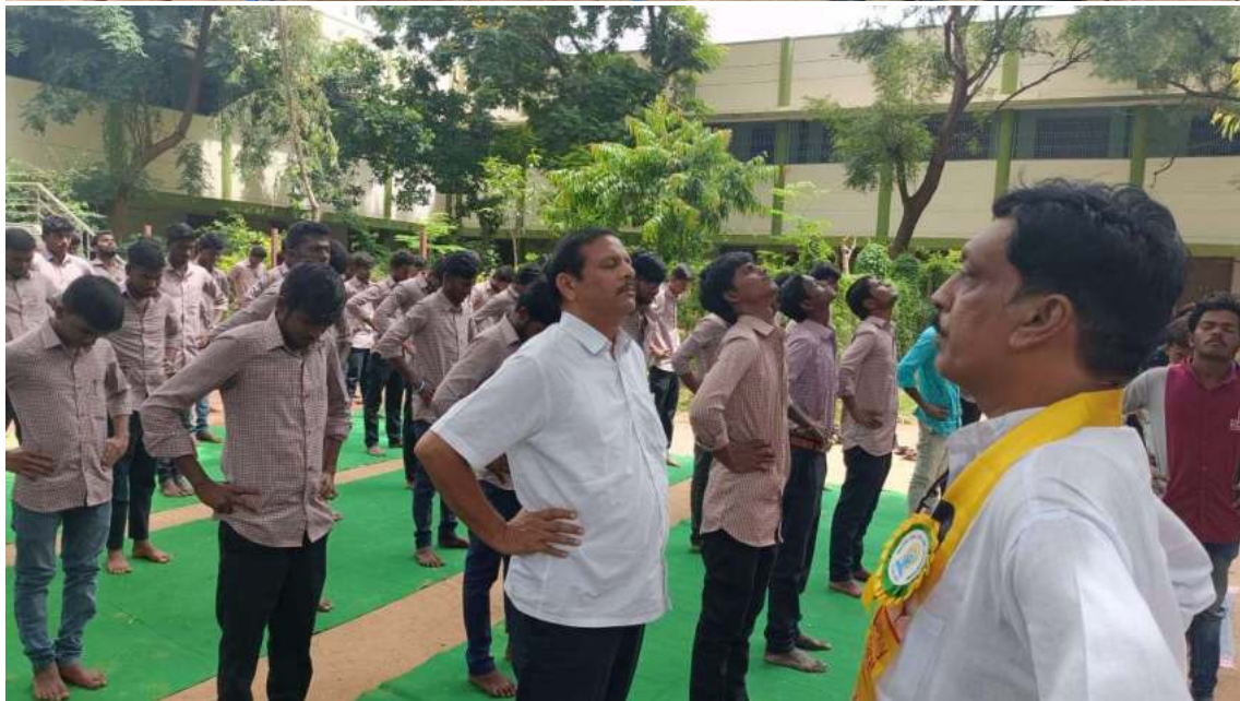
Principal and Vice Principal in Yoga Day celebrations. Nearly 200 students actively participated in this event