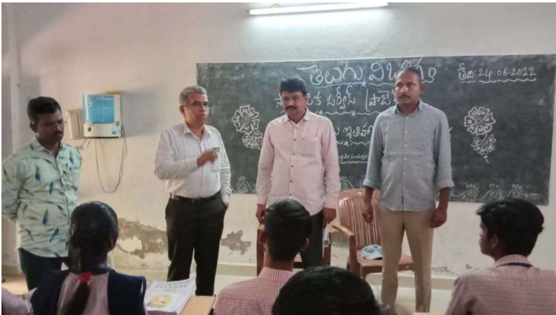
Principal and faculty mentors in Community Service Project presentation programme