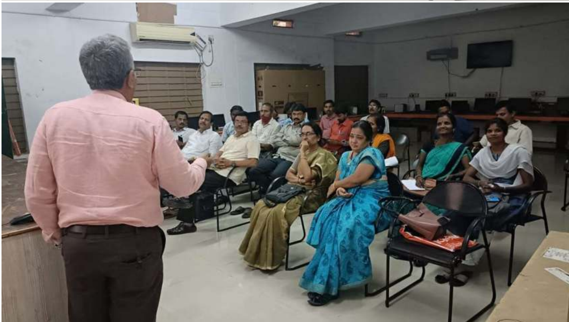
Faculty member discussing the modalities of filling up formats of academic audit