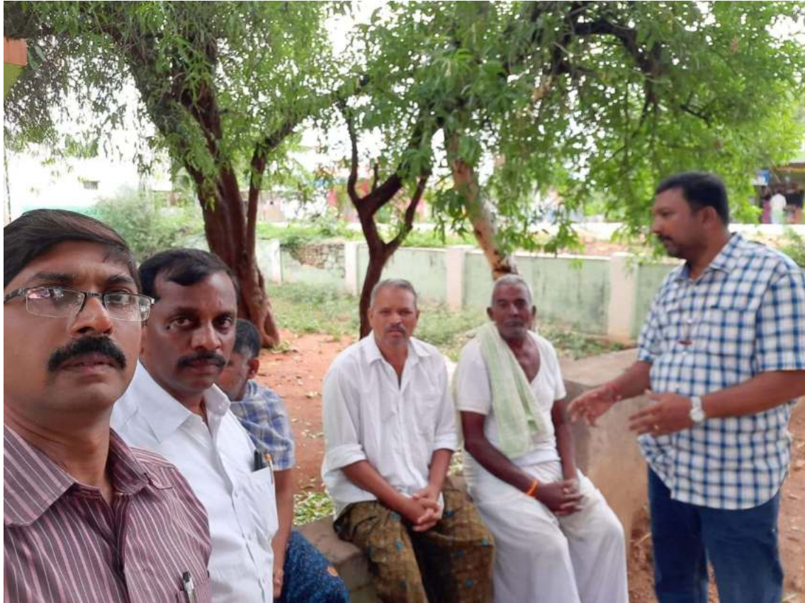
Interacting with parents in villages and enlightening them regarding the process of admissions