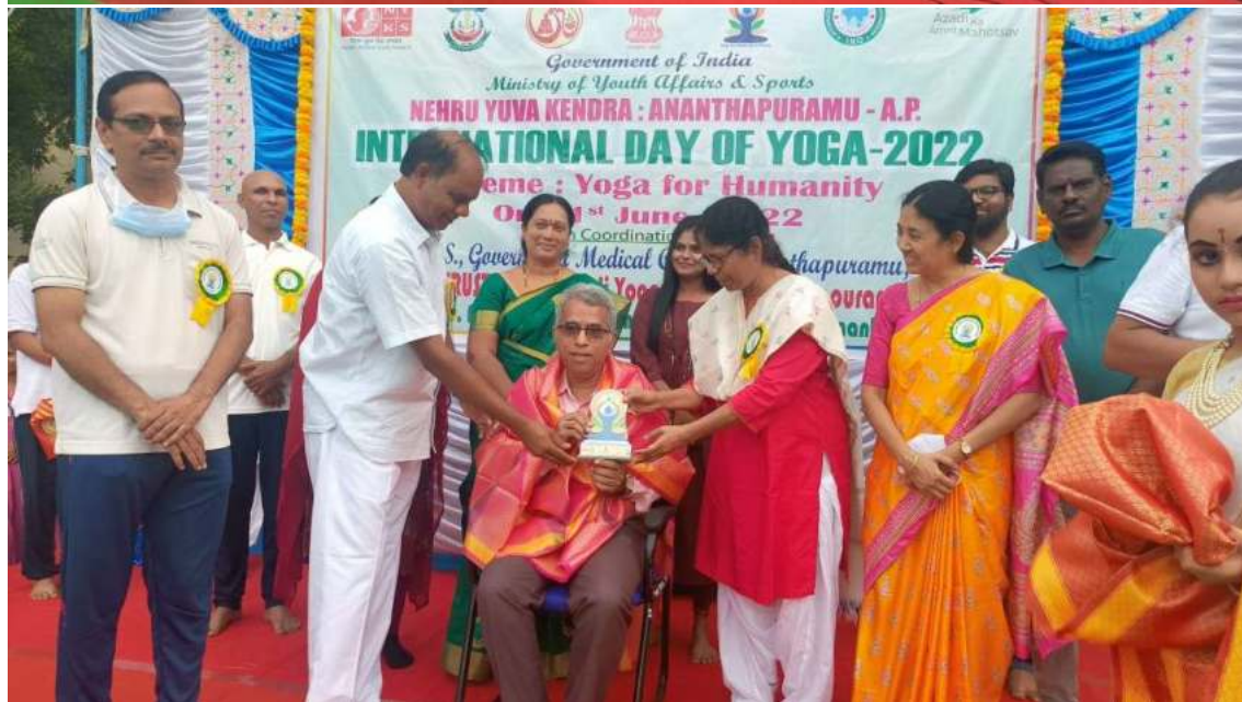
Faculty member attending Yoga Day celebrations in Government Medical College, Anantapur on June 21 st 2022 as a chief guest at 6am