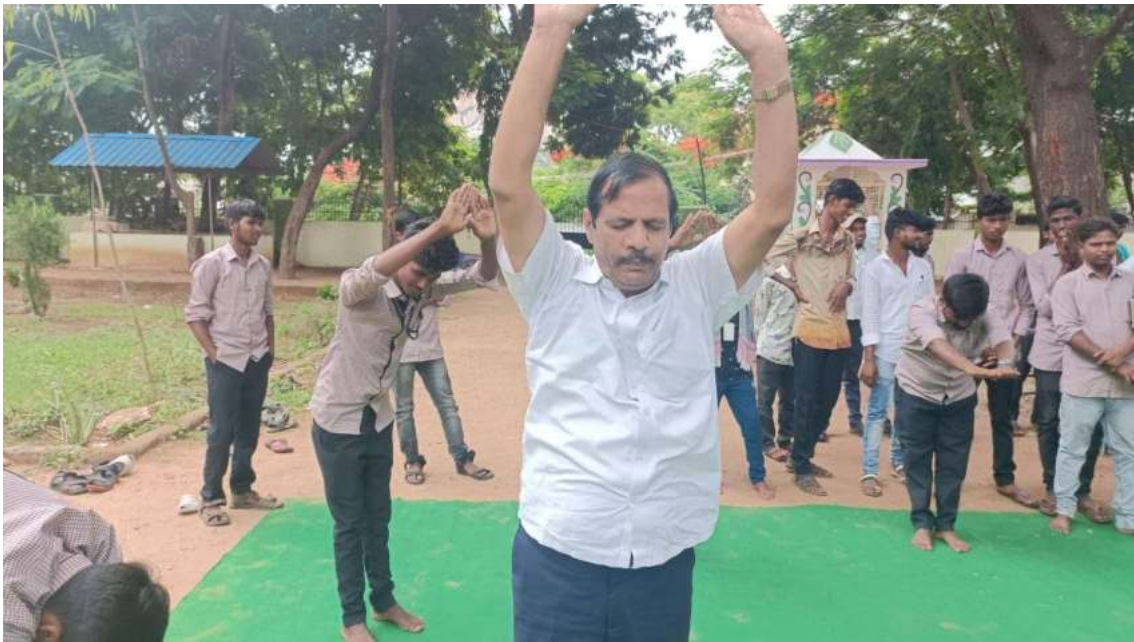
Faculty members and students in Yoga session organized in our college