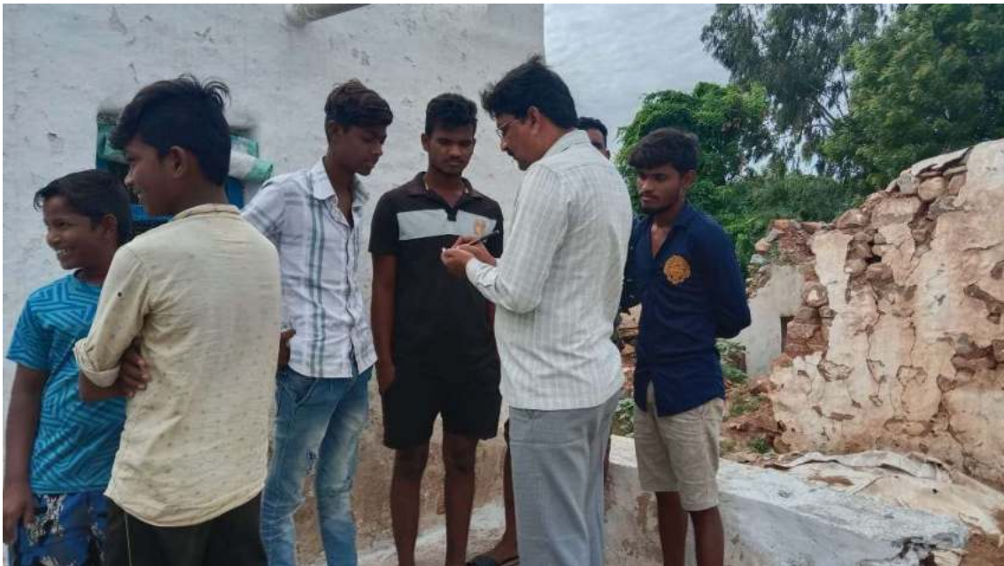
Door to door canvassing by our staff members as a part of admission drive